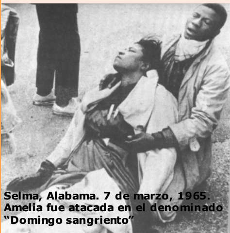
Selma, Alabama. 7 de marzo, 1965. Amelia fue atacada en el denominado "Domingo sangriento"