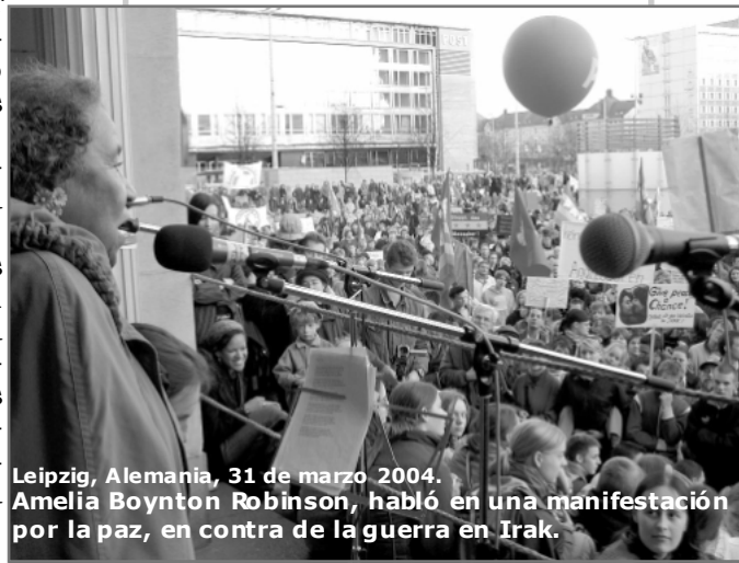
Leipzig, Alemania, 31 de marzo 2004. Amelia Boynton Robinson, habló en una manifestación por la paz, en contra de la guerra en Irak.

triumfo. Un ministro local quiso organizar una ceremonia para mi marido. A los diáconos les pareció que esto no era lo mejor, porque tenían miedo, y le temían al alto alguacil, quien organizó una cuadrilla armada. A pesar de todo, el ministro ganó, y mucha gente de color vino a la iglesia pasando por el cordón de los así designados alguaciles.