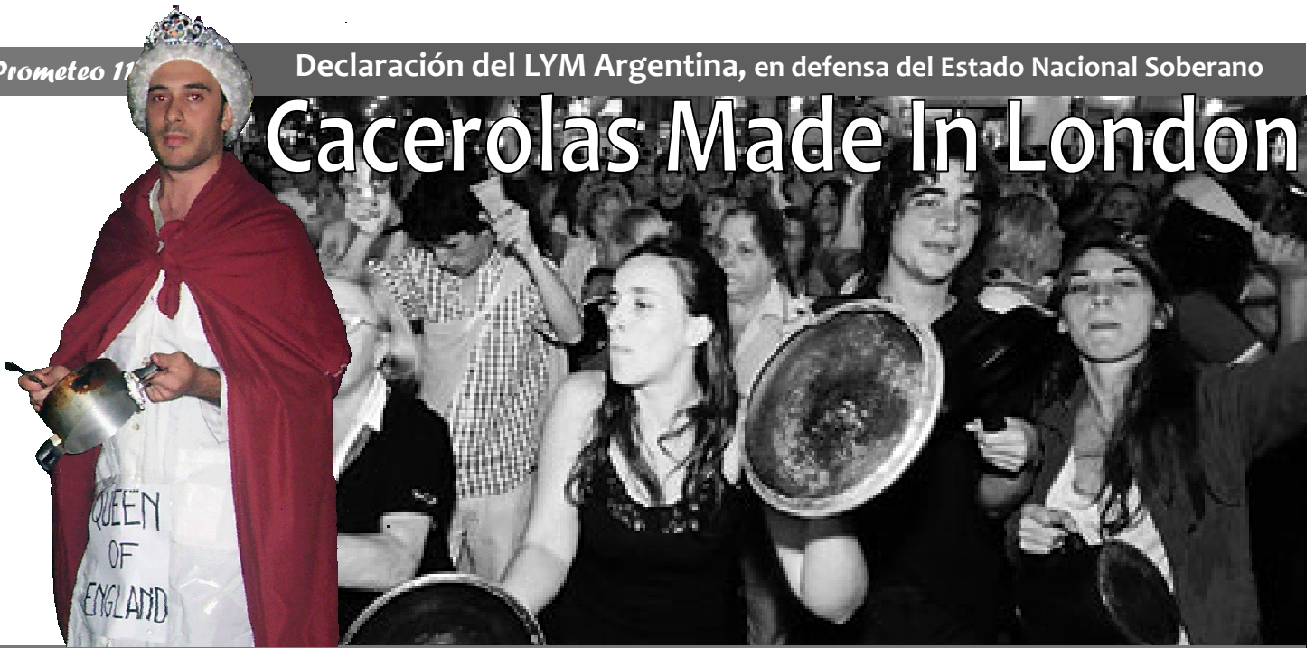
Fotos: La reina de Inglaterra (parodiada por un valiente miembro del LYM) se manifestó a favor de su propia campaña en contra de Cristina Kirchner.

La siguiente declaración, ha sido distribuida masivamente en medio del histórico conflicto resurgido en Argentina, entre el modelo de Estado Nacional Soberano, que protege y dirige la economía de la república, frente al liberalismo especulativo y la globalización del sistema imperial anglo-holandés.