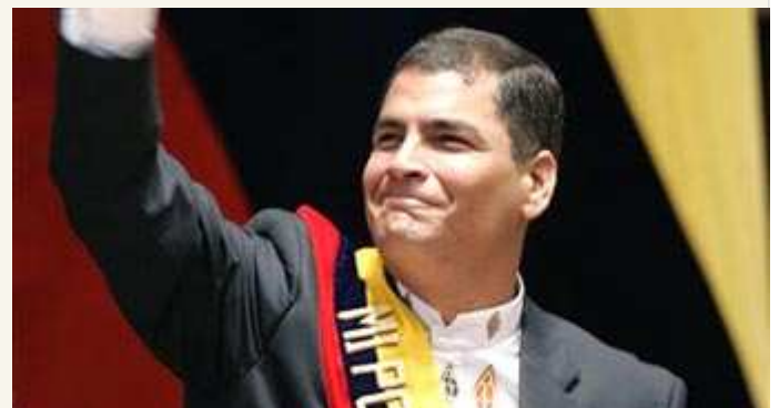
Presidente Ecuatoriano, Rafael Correa

El liderazgo mostrado por el presidente Argentino Néstor Kirchner, en su lucha contra los carteles financieros internacionales que buscan evitar a toda