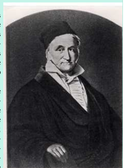
Carl, F, Gauss.

Es muy fácil darse cuenta del evidente freno al desarrollo de descubrimientos que estamos sufriendo; consecuencia de la decadencia cultural, moral e intelectual ocasionada por los medios de