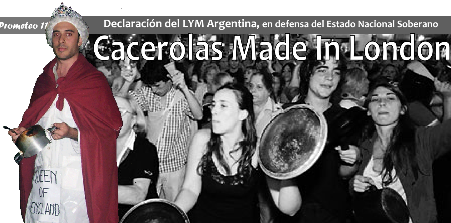
Fotos: La reina de Inglaterra (parodiada por un valiente miembro del LYM) se manifestó a favor de su propia campaña en contra de Cristina Kirchner.

La siguiente declaración, ha sido distribuida masivamente en medio del histórico conflicto resurgido en Argentina, entre el modelo de Estado Nacional Soberano, que protege y dirige la economía de la república, frente al liberalismo especulativo y la globalización del sistema imperial anglo-holandés.