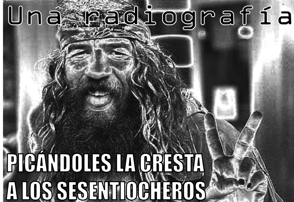
por Lyndon H. LaRouche, 6 de enero de 2008.

A cualquier observador bien informado ya se le ha advertido debidamente que la intención de intereses financieros internacionales muy poderosos es que se elija a un hombre montado sobre un corcel blanco, al alcalde de la Ciudad de Nueva York Michael Bloomberg, para que la campaña presidencial estadounidense de 2008 devenga en lo que los historiadores describirán, temblando, como la dictadura del Mussolini americano (o tal vez como algo peor) de enero de 2009.