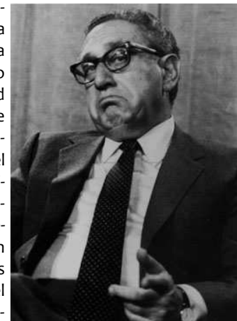
El agente británico Henry Kissinger y su proyecto de genocidio mediante globalización.

mento estratégico que emitieron cinco generales retirados, quienes cuentan el crecimiento poblacional y la distribución desigual de la curva demográfica en los distintos continentes como el primero de seis retos básicos que encara la comunidad mundial. Según los generales, esto representa la amenaza más grande a la prosperidad, el gobierno responsable y la seguridad energética. El modelo de esta visión imperial neomaltusiana del mundo es el infame estudio de seguridad nacional estadounidense NSSM 200 que redactó Henry Kissinger en 1974, el cual declara todas las materias primas del mundo un interés de seguridad estratégica de Estados Unidos.