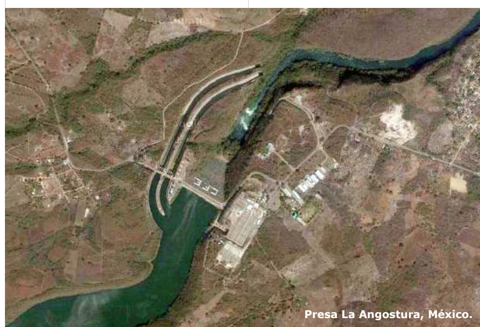
Presas La Angostura, México.

Esta misma perspectiva axiomática oligárquica subyace en el abominable docu-