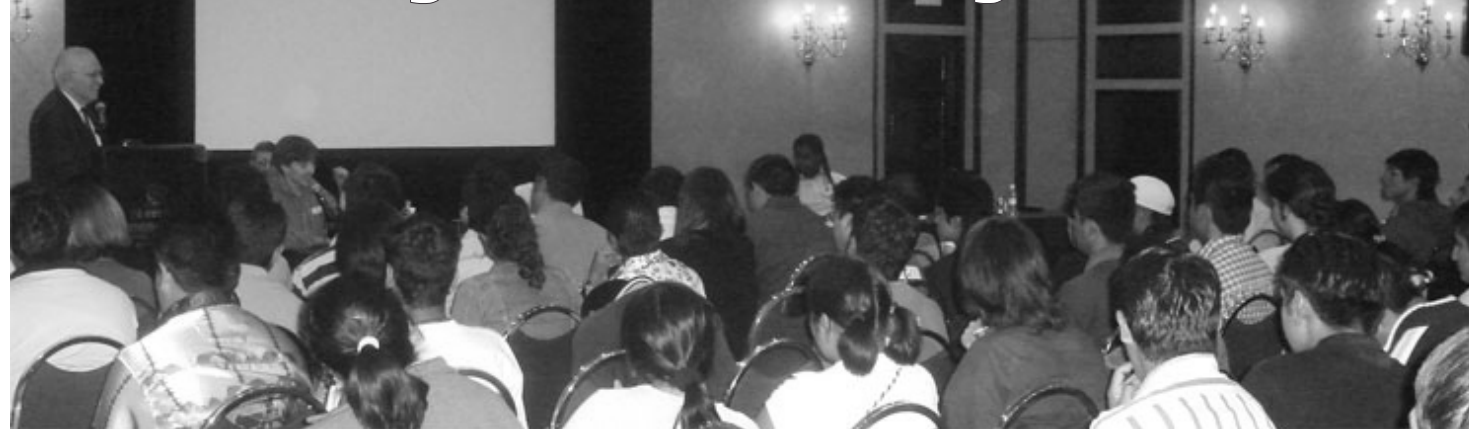
En su reciente visita a México, LaRouche dio presentaciones ante universidades, sindicalistas, y su movimiento de jóvenes.

El estadista y economista físico norteamericano Lyndon LaRouche visitó la ciudad de Monterrey durante los días 18 y 19 de abril de este año, con la ocasión de participar en un seminario de Relaciones Internacionales auspiciado por el Instituto Tecnológico de Monterrey como principal ponente internacional. Aprovechando su visita se le realizaron entrevistas en diferentes programas radiales como Radio UNAM y Radio ABC, a su vez mantuvo diálogos con un grupo de setenta jóvenes, entre miembros y contactos de su Movimiento Internacional y con una delegación del Comité Pro PLHINO del estado norte de Sonora y la ciudad de Obregón.