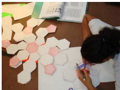
Lyndon LaRouche, está gestando una movilización internacional de jóvenes, el cuál crecientemente representa un cambio de paradigma cultural, desde el método de pensamiento basado en el descubrimiento individual de ideas fundamentales.