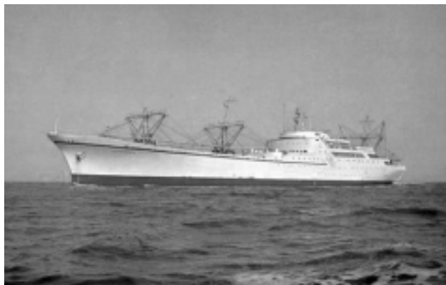
El NS Savannah fue el primer buque nuclear de carga y pasajeros, producto del optimismo del proyecto Átomos para la Paz, y puede circunnavegar la Tierra 14 veces sin reabastecerse de combustible. (Foto: Administración Marítima de EU).

Para septiembre de 1966 el proyecto del Distrito de Agua Metropolitano iba bien, y fue calificado de “la primera aplicación de desalación de propósito doble de su tipo y tamaño en el mundo”, durante las audiencias de la Comisión Conjunta de Energía Atómica del Congreso sobre el proyecto.