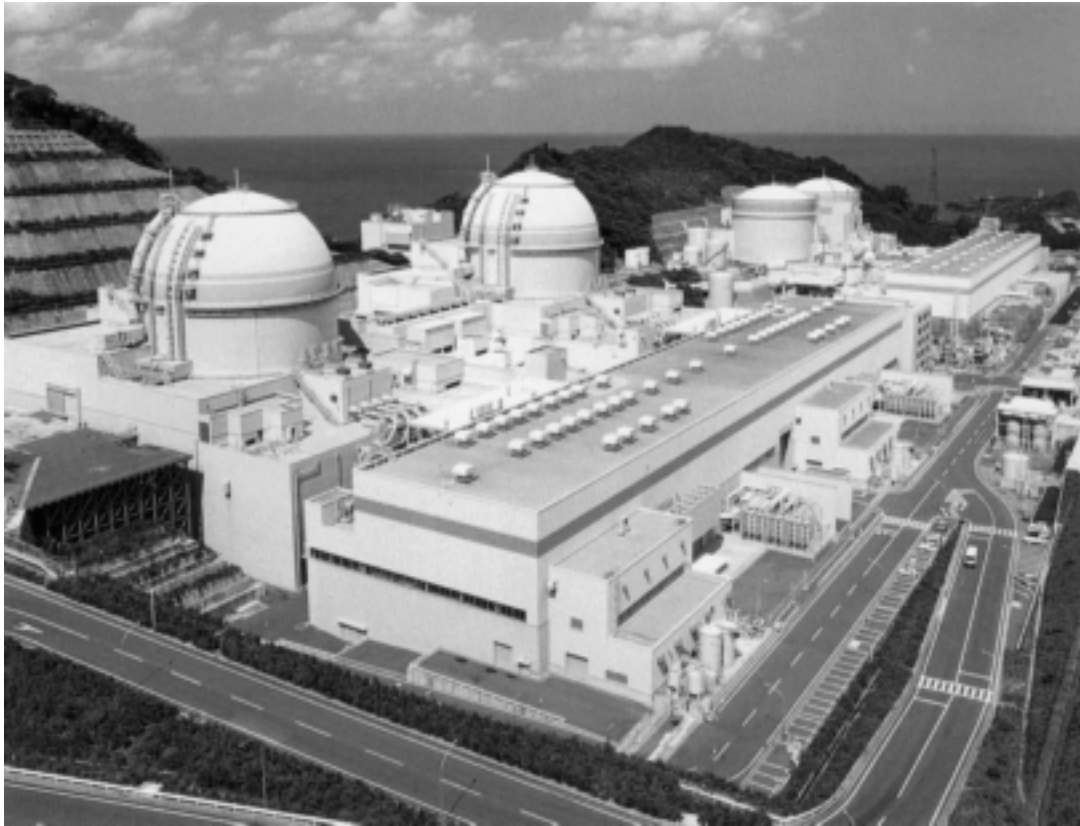
La planta de generación eléctrica Ohi fue el primer gran proyecto de desalación nuclear de Japón. (Foto: Organismo Internacional para la Energía Atómica).

El proyecto nunca se completó. Por desgracia, la “Propuesta para nuestro tiempo” de Eisenhower nunca vio la luz, pues los fanáticos de la no proliferación y sus marionetas del movimiento ambientalista manipularon y transformaron el optimismo nuclear de la nación en miedo y pesimismo.