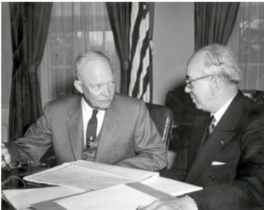
El presidente estadounidense Eisenhower (izq.) y Lewis Strauss (der.) propusieron en 1967 un enorme proyecto de desalación nuclear para el Oriente Medio, a fin de fomentar la paz y la estabilidad mediante el abasto de agua para el desarrollo económico. (Foto: Biblioteca Eisenhower).

día, sin importar qué energía impulse a un buque trasatlántico, la desalación de agua potable es la norma y mucho más sensato que viajar con una bodega llena de agua potable por todo el océano.